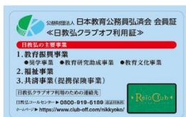
日教弘会員証 オモテ

A4 日教弘会員証の裏面に記載されている10桁の数字です。申請時には、この会員証番号の入力が必須となります。 (※証券番号とは異なります。)