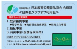
日教弘会員証 オモテ

A3 日教弘会員証裏面に記載の数字10桁の会員証番号です。Web申請を行う際に入力必須の番号です。