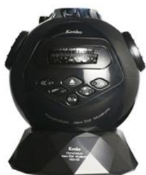
スターミュージアム