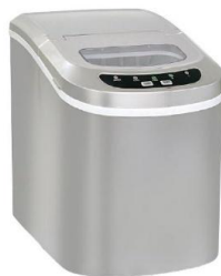
高速製氷機シルバー