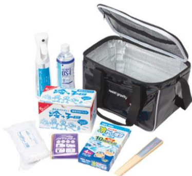
熱中症対策救急セット