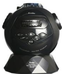
スターミュージアム